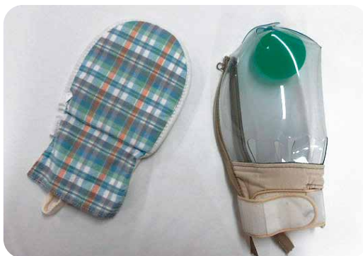
一時的に手の動きを抑える用具

近年、医療や介護の現場では「患者さんの尊厳を守り、出来る限り身体的拘束を行わない」という考え方が広がっています。人権への意識の高まりや診療報酬改定を背景に、全国の病院や施設で身体的拘束を最小化する取り組みが進められています。こうした社会的な流れを受け、当院でも多職種が連携する身体的拘束最小化チームが活動しています。看護職は、その中心的役割を担い、日々のケアの中で「本当に拘束が必要か」「他の方法はないか」を丁寧に話し合い、患者さん一人ひとりに寄り添った支援を行っています。これからも当院は、専門的な取組みを通じて、患者さんが安心して過ごせる環境を整え、病院全体で身体的拘束のさらなる最小化を目指してまいります。