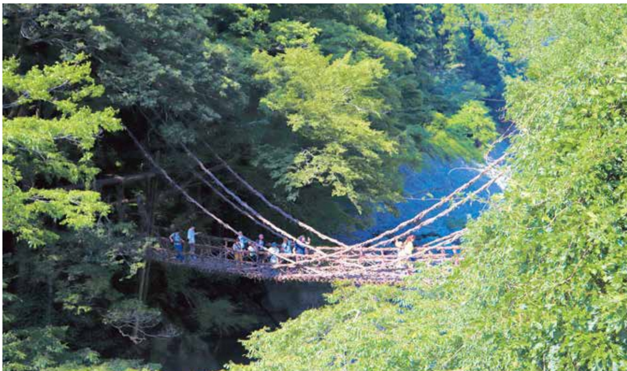
「祖谷のかずら橋（徳島県）」