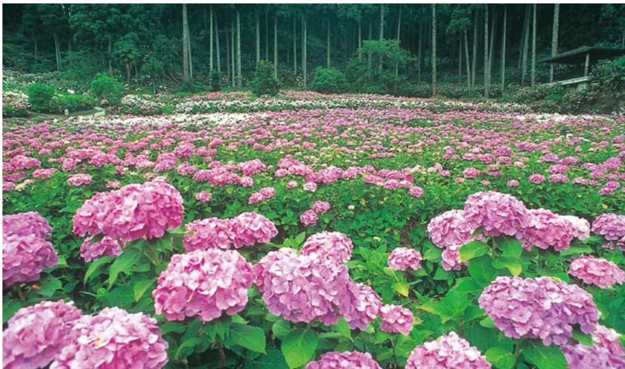
200種1万株ものアジサイが色鮮やかに咲き誇る服部農園（茂原市三ヶ谷）

●発行年月日/平成22年7月1日 ●編集/船橋市立医療センター広報委員会 ●発行責任者/院長 高原 善治 〒273-8588 船橋市金杉1-21-1 ☎047-438-3321(代) http://www.mmc.funabashi.chiba.jp/