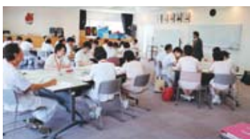
5月18日に実施した管理職研修

当院では、マネジメント能力を強化するため、看護部とメディカルの管理職を対象に、初めてとなる管理職研修を実施しました。