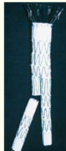
ステントグラフト本体