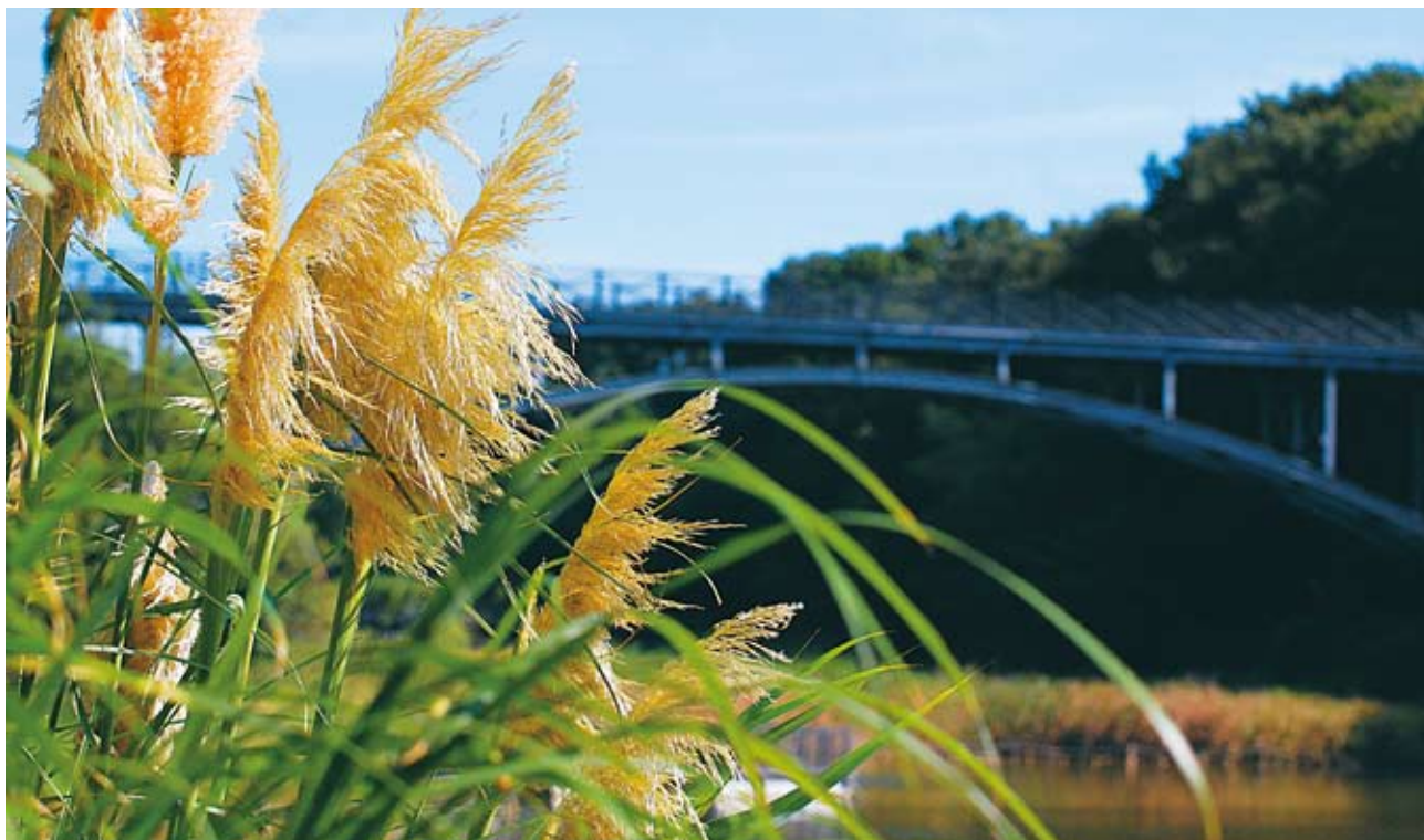
太陽の橋（ふなばしアンデルセン公園にて）

●発行年月日/平成22年10月1日 ●編集/船橋市立医療センター広報委員会 ●発行責任者/院長 高原 善治 〒273-8588 船橋市金杉1-21-1 ☎047-438-3321(代) http://www.mmc.funabashi.chiba.jp/