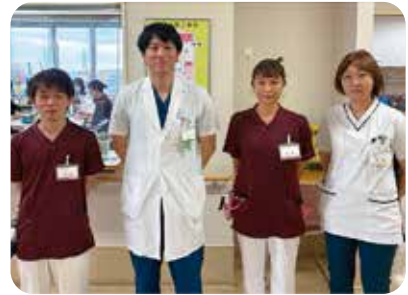
排尿ケアチームです！

手術の後など、体の状態によっては「おしっこを出すための管（カテーテル）」が必要になることがあります。しかし、その管を抜いた後に「おしっこが出にくい」「全く出ない」という状態になることがあります。