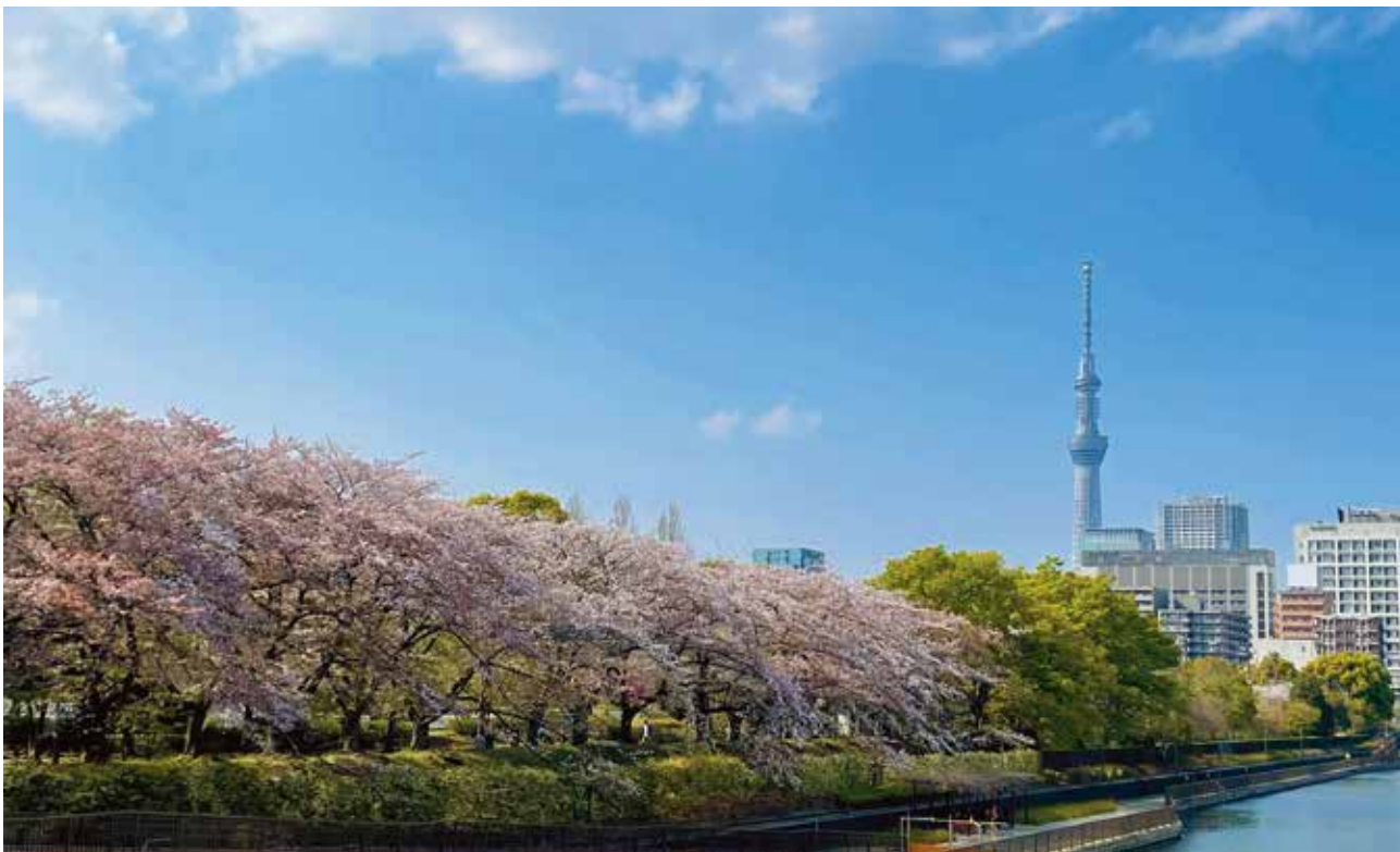
「猿江恩賜公園の桜とスカイツリー」 当院職員撮影

●発行年月日/令和8年4月1日 ●編集/船橋市立医療センター広報委員会 ●発行責任者/院長 茂木 健司 〒273-8588 船橋市金杉1-21-1 ☎047-438-3321(代) https://www.mmc.funabashi.chiba.jp